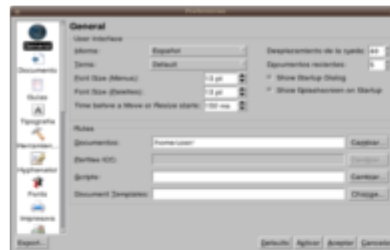
1.- Ventana de configuración

Si deseas configurar un documento lo puedes hacer de la siguiente manera: Menú Archivo -> Configuración del documento -> seleccione la opción que desee configurar del documento.